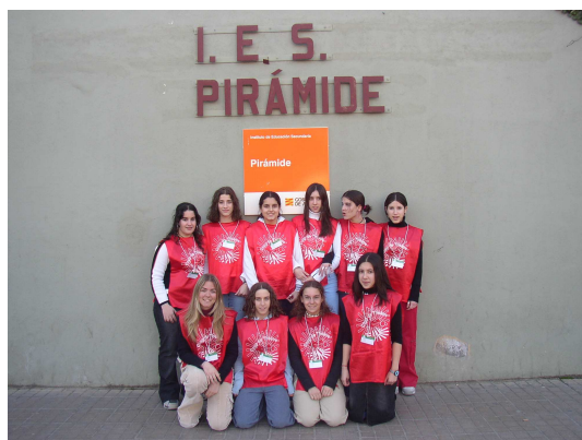
Voilà notre équipe de protocoles.