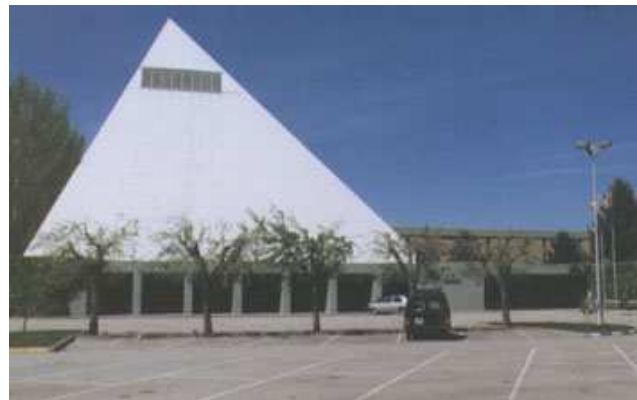
Une photo du lycée "Pirámide" de Huesca.

Juste en rentrant, dans le hall vous trouverez la première puis tout le long des couloirs, sur n'importe quel mur. Elle change tous les mois et elle parle de sujets qui