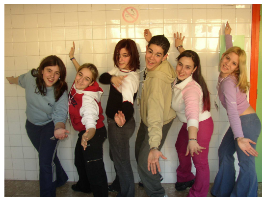
Et voilà les présentateurs du festival.